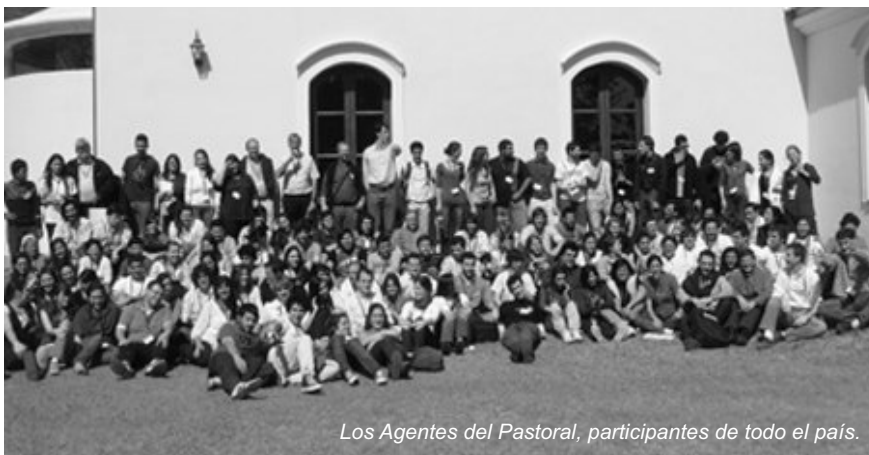
Los Agentes del Pastoral, participantes de todo el país.

con las mismas preocupaciones, y problemáticas que nosotros, que intercambiaron experiencias y soluciones bajo la mirada de Nuestro Señor Jesucristo.*